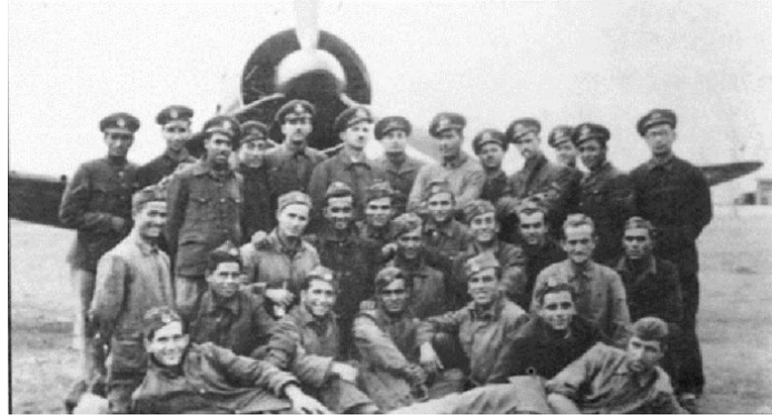
Προσωπικό της 24ης Μοίρας Διώξεως