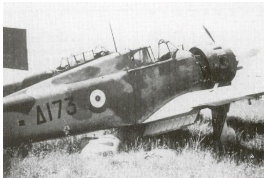
Α/φος Bloch MB 151 με Αριθμό Δ173-Το Α/φος του Γ. Μόκκα είχε Αριθμό Δ172